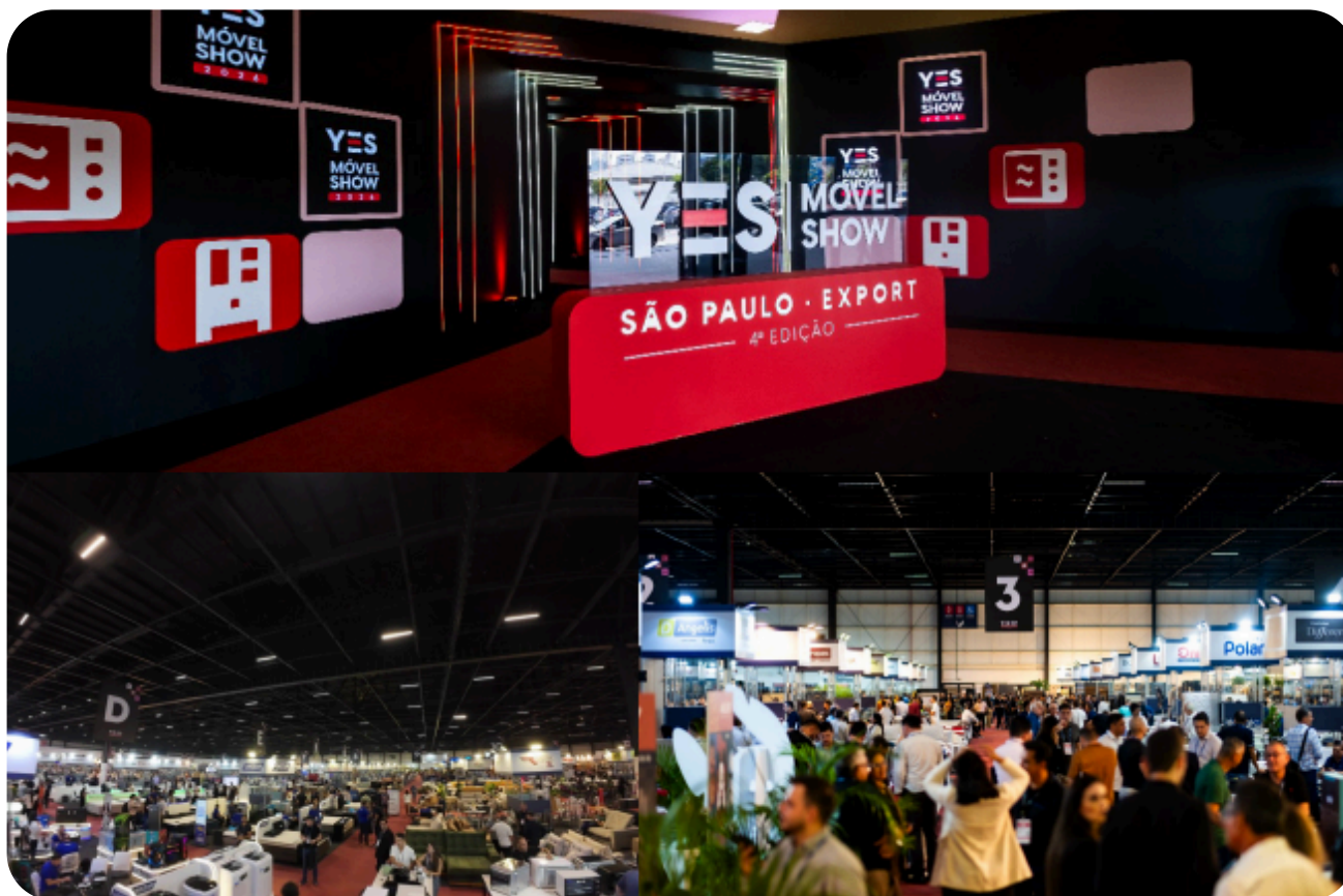
Figura 1 – Imagens da Yes Móvel Show São Paulo 2025

O Yes Móvel Show São Paulo, é a plataforma de negócios mais relevante para o setor no Brasil.